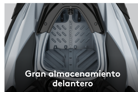
Gran almacenamiento delantero

El motor Rotax® 900 ACE™ - 90 ofrece una ágil aceleración con gran rendimiento de combustible y, para aquellos que desean un desempeño adicional, la potencia añadida del motor 1630 ACE™ - 130 ofrece total diversión y aceleración.