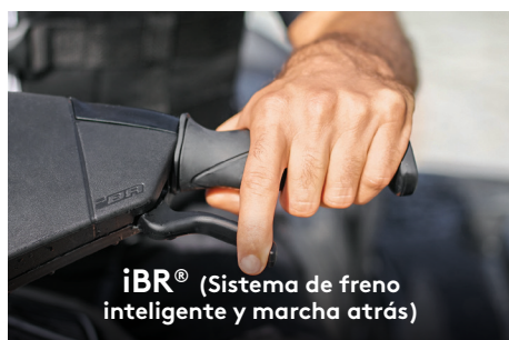
iBR® (Sistema de freno inteligente y marcha atrás)

El exclusivo sistema iBR® de Sea-Doo® detiene la moto acuática más rápido y ofrece mayor control y maniobrabilidad a bajas velocidades y en reversa.