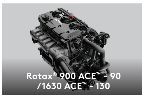
Rotax® 900 ACE™ - 90 /1630 ACE™ - 130

El exclusivo sistema iBR® de Sea-Doo® detiene la moto acuática más rápido y ofrece mayor control y maniobrabilidad a bajas velocidades y en reversa.