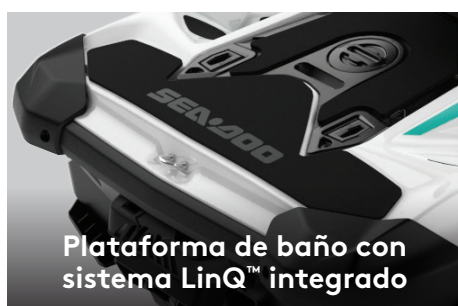
Plataforma de baño con sistema LinQ™ integrado

Una impresionante capacidad de 40 galones de espacio de almacenamiento sellado permite a los pilotos guardar sus pertenencias mientras conducen.