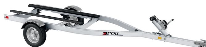
MOVE I Extended 1250 de aluminio

©2019 Bombardier Recreational Products Inc., (BRP). Reservados todos los derechos. ™, ® y el logotipo de BRP son marcas comerciales de Bombardier Recreational Products Inc. o de sus filiales. Los productos son distribuidos en los EE. UU. por BRP US Inc. Debido a su compromiso continuo con la calidad y la innovación en los productos, BRP se reserva el derecho de interrumpir o modificar en cualquier momento especificaciones, precios, diseños, características, modelos o equipamiento sin que ello suponga ninguna obligación. Impreso en Canadá. 1 Basado en pruebas internas de BRP.