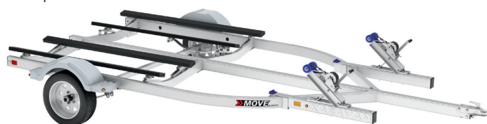
MOVE II de aluminio