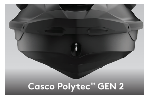
Casco Polytec™ GEN 2

Esta característica exclusiva de Sea-Doo® optimiza el rendimiento de potencia para obtener una mejor eficiencia de combustible de hasta 46%. 1